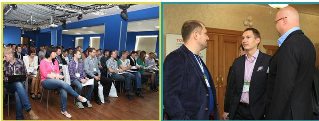
138 ИКТ-профессионалов стали участниками Международного Форума «Бизнес и ИТ. Вокруг ЦОД. Вокруг Облака. Вокруг IP» в Хабаровске

На сегодняшний день Форум представляет собой идеальную площадку для бизнес-коммуникаций , объединяющую наиболее инициативных представителей отечественного ИКТ-рынка. Стоит отметить, что в этом году в мероприятии приняли участие 138 ИКТ-специалистов и директоров!