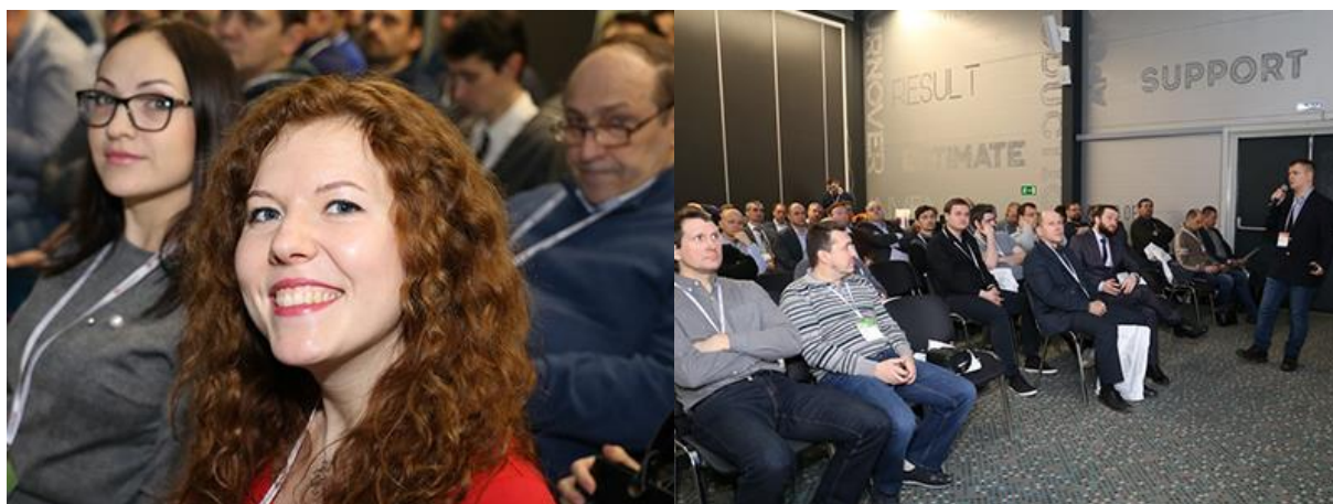
Международный Форум ВIT-2019 в Ростове-на-Дону собрал 209 участников

Форум представляет собой удобную площадку для коммуникаций , объединяющую наиболее инициативных представителей отрасли. Отметим, что в этом году форум посетили 209 участников!